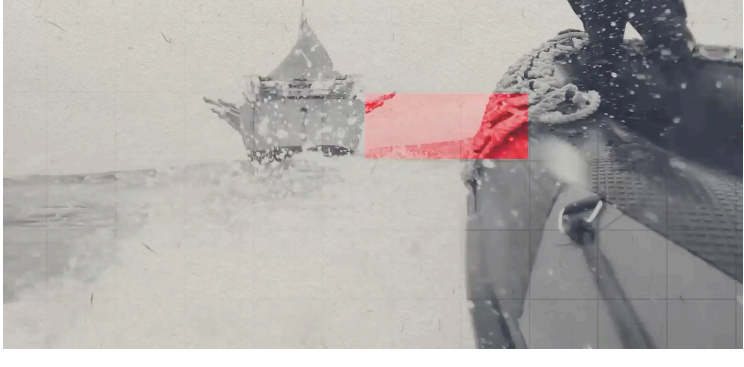
Die Journalisten des Outlaw Ocean Project sind selbst auf See gegangen.

ZEIT ONLINE: Aber es verändert sich doch was. Vor ein paar Jahren noch wurden die am schlimmsten ausgebeuteten Leute auf diesen Schiffen, die Handlanger an Deck, für wenig Geld in Indonesien und anderen Ländern angeworben. Seit dem Ausbruch der Covid-19-Pandemie werden hauptsächlich Chinesen an Bord geschickt, genießen die nicht ein bisschen mehr Schutz?