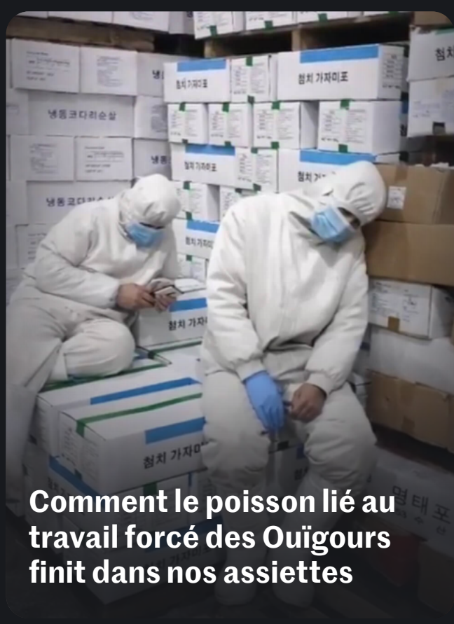
Comment le poisson lié au travail forcé des Ouïgours finit dans nos assiettes

A l'issue de quatre années d'enquête, les journalistes du collectif The Outlaw Ocean Project révèlent comment les transferts de main-d'œuvre imposés par la Chine aux Ouïgours vers les usines de poisson chinoises touchent toute la chaîne d'approvisionnement, de l'Europe aux Etats-Unis, et le coût humain de la course effrénée à la pêche pratiquée par la Chine sur les mers du globe.