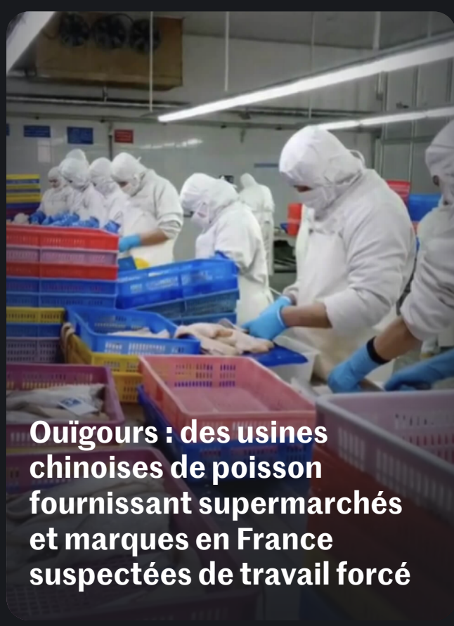
Ouïgours : des usines chinoises de poisson fournissant supermarchés et marques en France suspectées de travail forcé