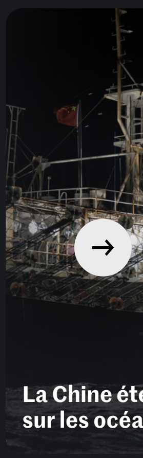
La Chine ét...