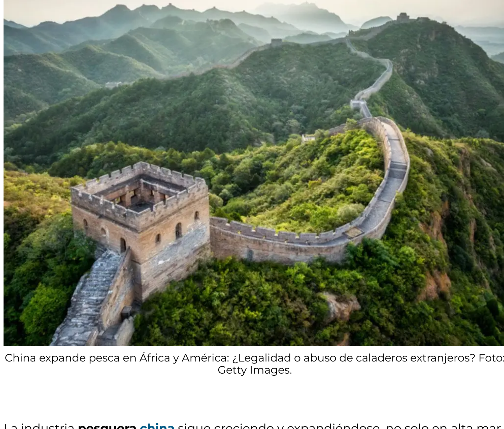
China expande pesca en África y América: ¿Legalidad o abuso de caladeros extranjeros?

POR: BARBARA.GARCÍA | ACTUALIDAD - 10 AGO, 2024