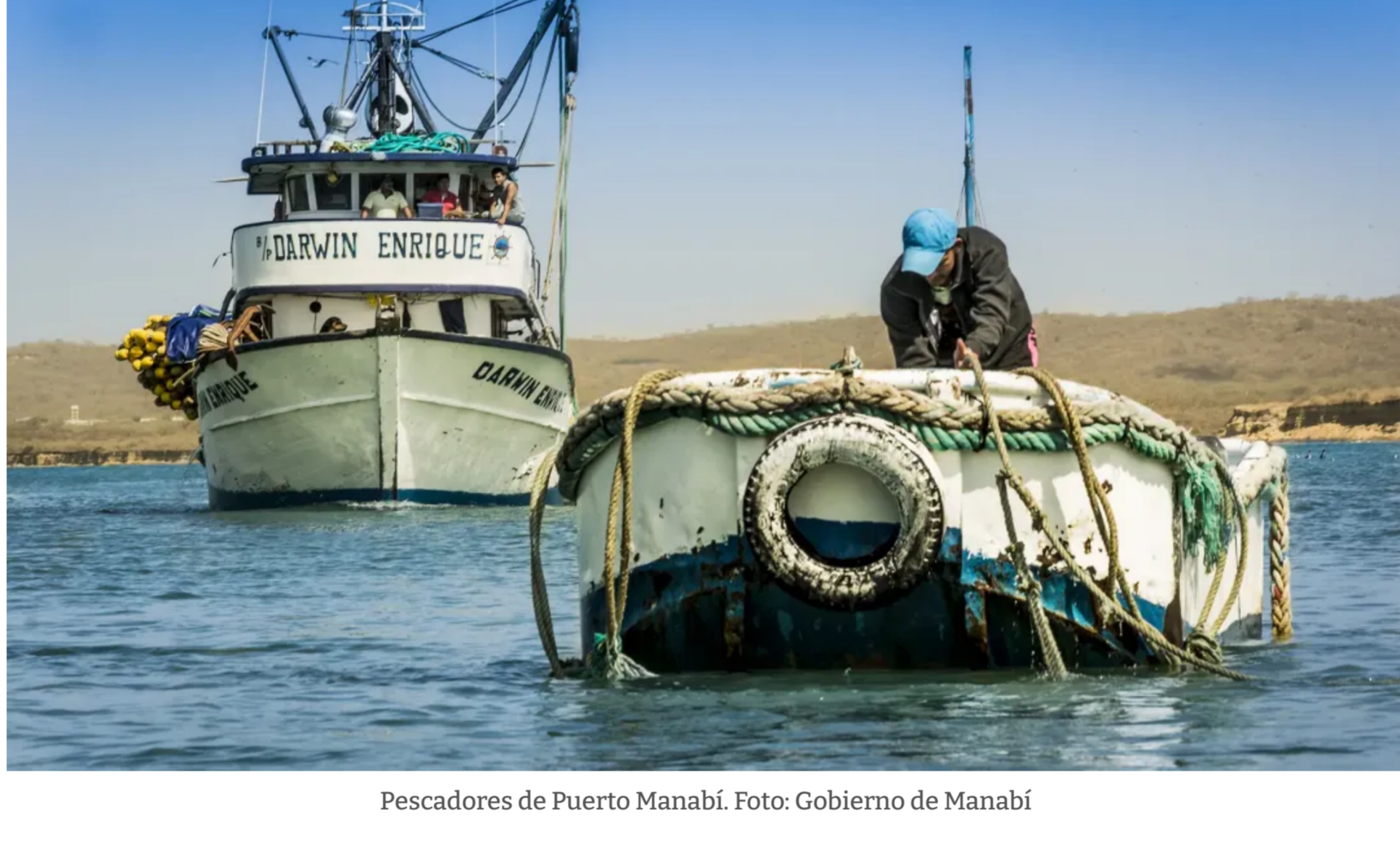
Pescadores de Puerto Manabí.

Y todo es por escasez . Desde hace meses que no se encuentra en los mercados. En redes sociales abundan los videos de pescadores quejándose porque se han visto obligados a recolectar conchas de abanico para sobrevivir, ya que no hay pota para pescar. Los han dejado sin trabajo .